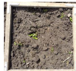
Passage Nucrop +15 jours