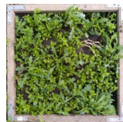
Témoin à + 15 jours